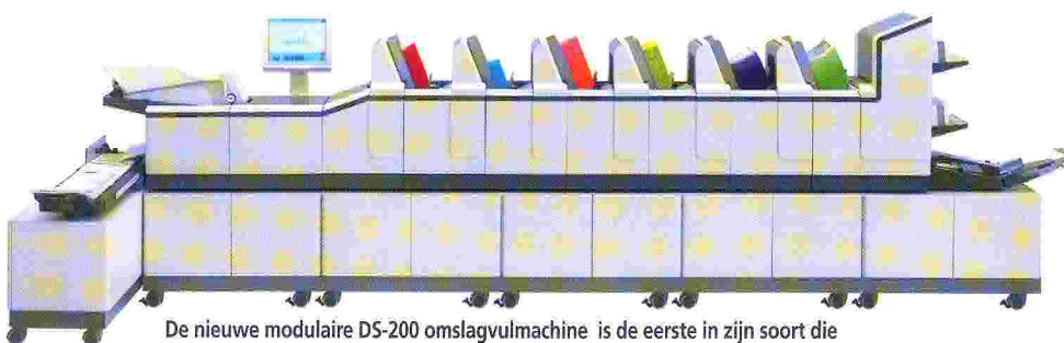
De nieuwe modulaire DS-200 omslagvulmachine is de eerste in zijn soort die C4 omslagen met de klep aan de lange zijde kan verwerken.